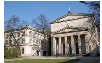
Außenansicht St. Elisabeth mit Villa

Bewerben Sie sich auch gern, wenn Sie nicht alle Anforderungen der Ausschreibung erfüllen. Wir begrüßen alle Bewerbungen unabhängig von Geschlecht, Nationalität, ethnischer und sozialer Herkunft, Religion, Behinderung, Alter sowie sexueller Orientierung und Identität.