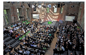
Preisverleihung durch Angela Merkel