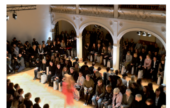
Modenschau in der Villa Elisabeth