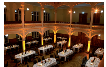
Villa Elisabeth, Aufbau für Dinner im Saal